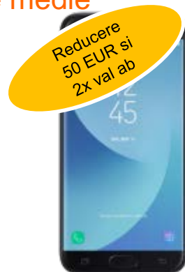
Samsung J5 2017 DUAL SIM 125 EUR reduc: 75EUR / 54.2EUR Prelungire / Nou, portat, ppy