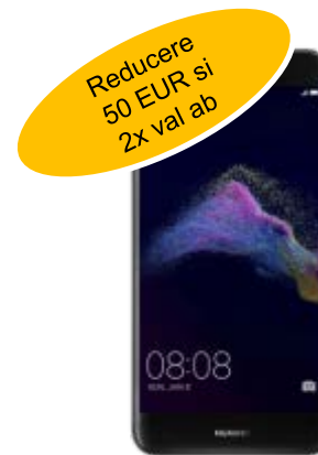
Huawei P9 LITE DUAL SIM 118 EUR reduc: 68EUR / 47.2EUR, Prelungire / Nou, portat, ppy,

abonament 8,6 EUR sau pana la 5.16 EUR (fara telefon)***