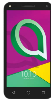
Alcatel U5 5 inch 41.18 EUR