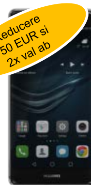
Huawei P9 194 EUR