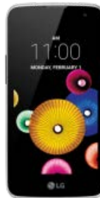
LG K4 2017 16 EUR