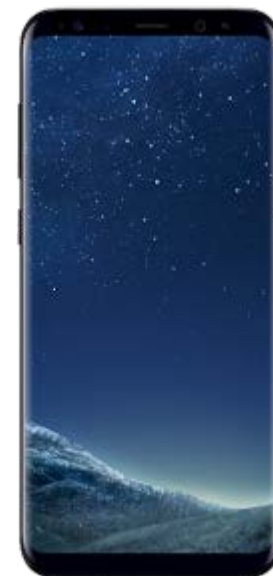
Samsung Galaxy S8 84.71 EUR