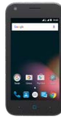
ZTE Blade L110 N DUAL SIM 0 EUR