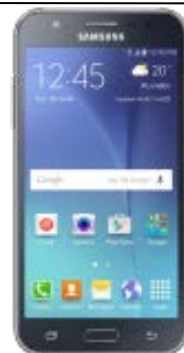
Samsung Galaxy J3 47.2 EUR