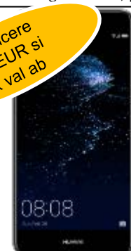
Huawei P10 LITE DUAL SIM 131 EUR