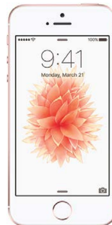
Iphone SE 32 GB 0 EUR