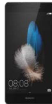
Huawei P8 LITE DUAL SIM 47 EUR