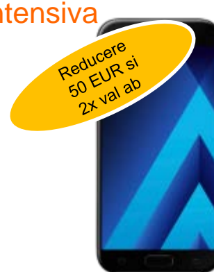
Samsung Galaxy A5 2017 148 EUR