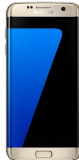
Samsung S7 EDGE 108.4 EUR