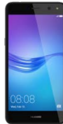
Huawei Y6 2017 DUAL SIM 43 EUR