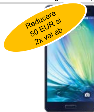
Samsung Galaxy A3 2017 131 EUR